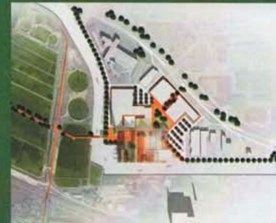
Bovenaanzicht van de planningsruimte van het gebied. Top view of the planning area.

Van Beek is happy with his Design Academy Eindhoven background: "I was trained to have a comprehensive look at projects; besides, within the department there is a lot of attention for the idea and implementation. Anyone can draw a 3D view now. But it's just as important to create a broad support base. After all, once a project is finished, it should continue living."