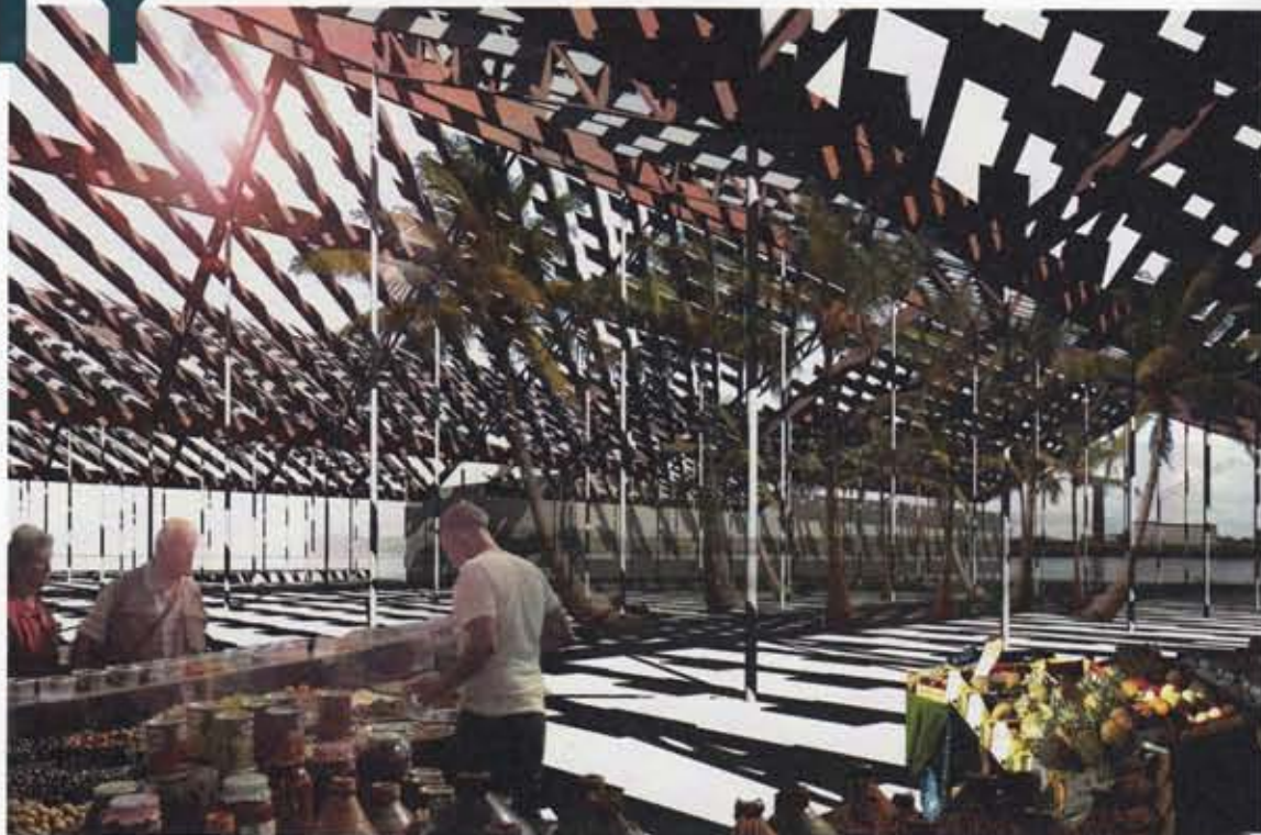
Aanzicht van de binnenzijde van de markthal. Op de grond is het schaduw patroon van de zonnepanelen te zien. Inside view of the market hall, showing the shadow pattern of the solar panels on the ground.